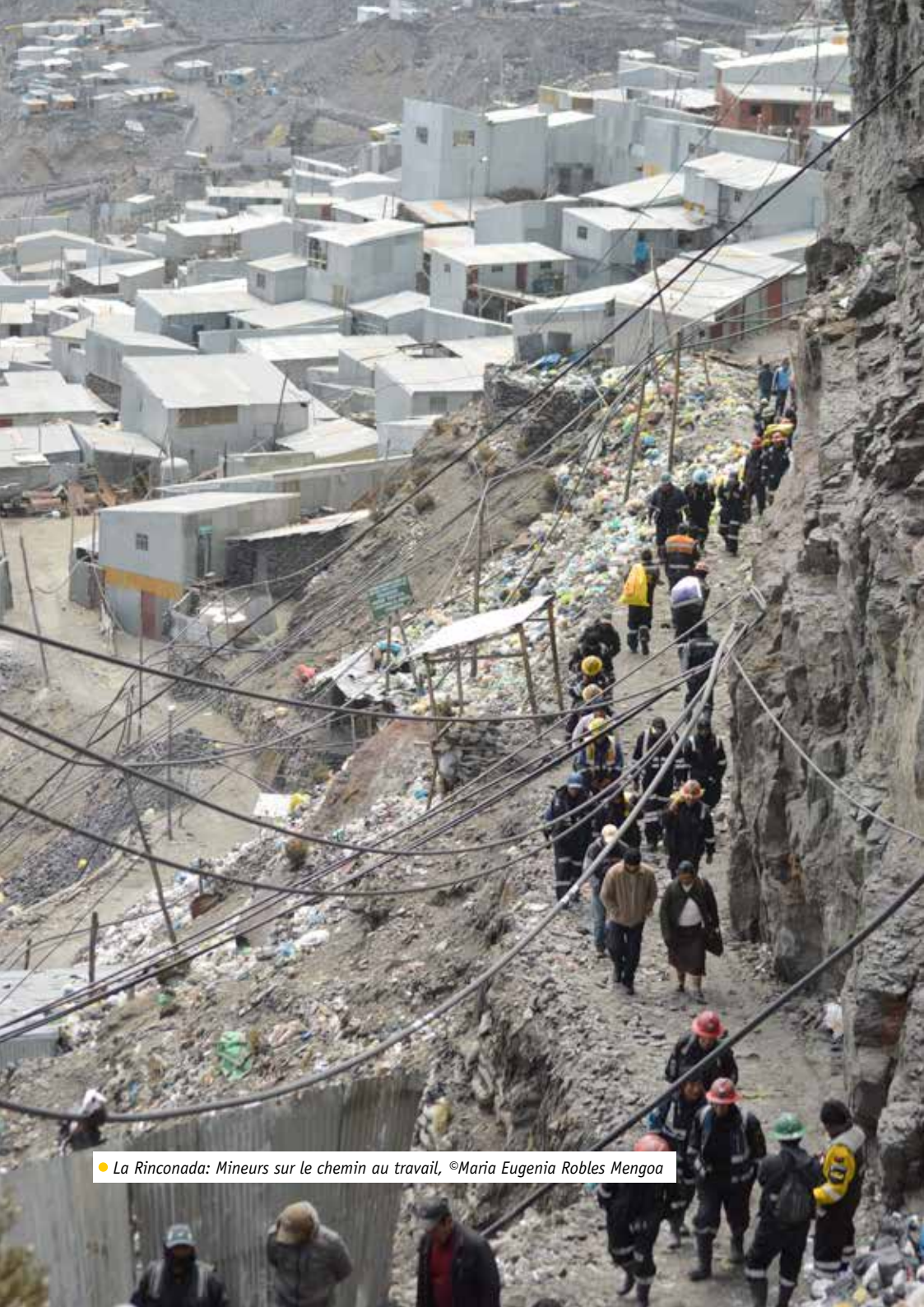
● La Rinconada: Mineurs sur le chemin au travail, ©Maria Eugenia Robles Mengoa