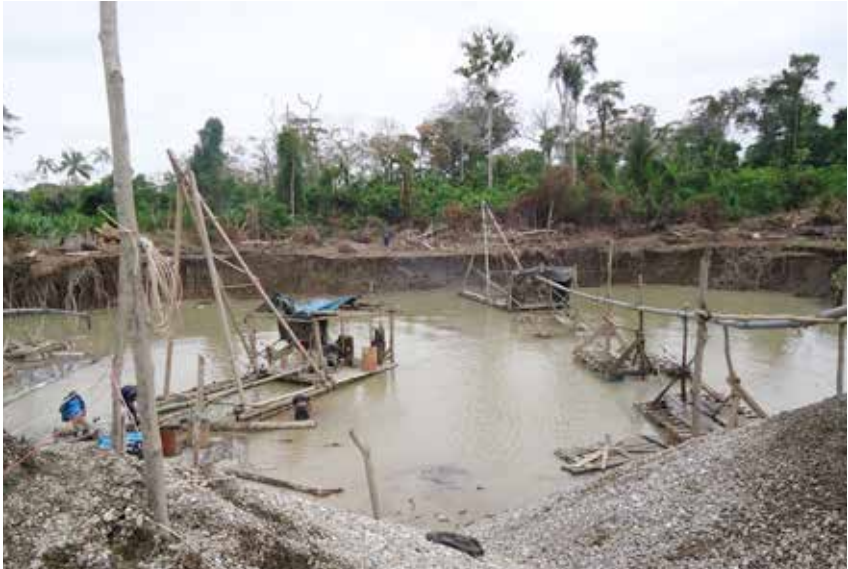
● Exploitation d'or dans la région Madre de Dios