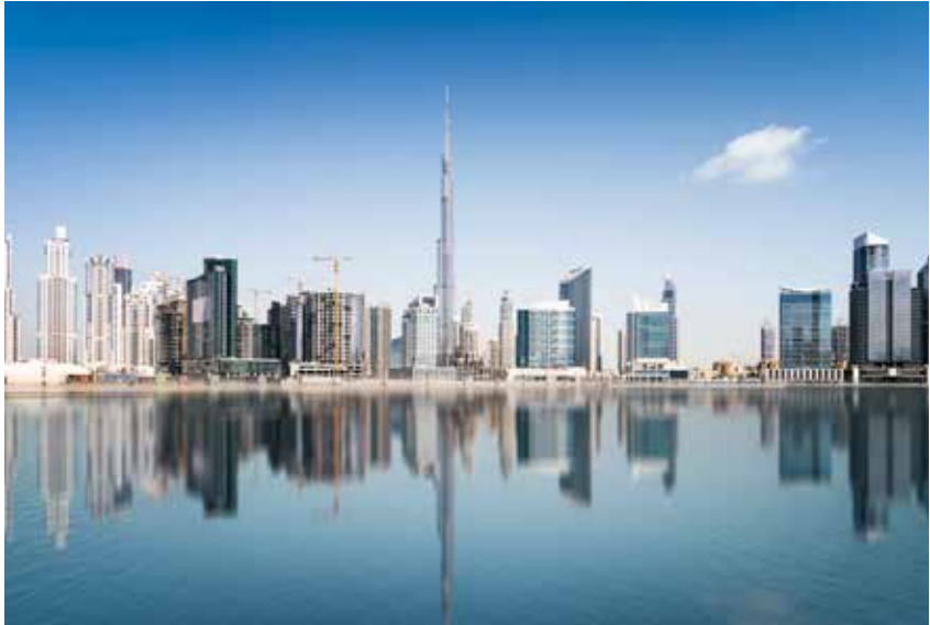
● Dubaï est une plateforme importante pour le commerce global d'or

plus grande raffinerie de Dubaï, Kaloti Jewellery International respectivement Kaloti Jewellers Factory (les deux ci-après nommés Kaloti). L'analyse des données non publiées tiré du document « Know Your Client » (KYC) de Kaloti, dont la SPM possède une copie, révèle que les 18 fournisseurs étaient tous enregistrés au Soudan, pays qu'ils avaient par ailleurs tous déclaré comme pays d'origine de l'or qu'ils avaient transformé.