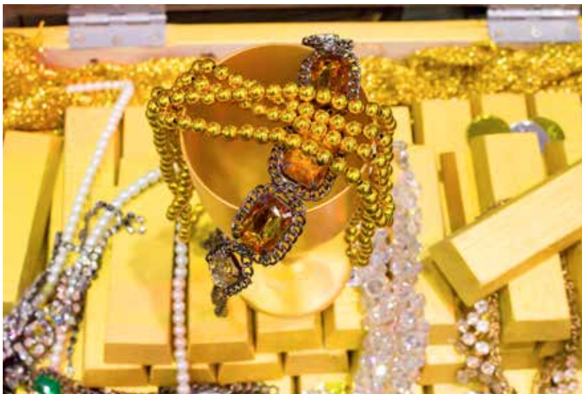
● Choix de marchandises au gold souk à Dubaï