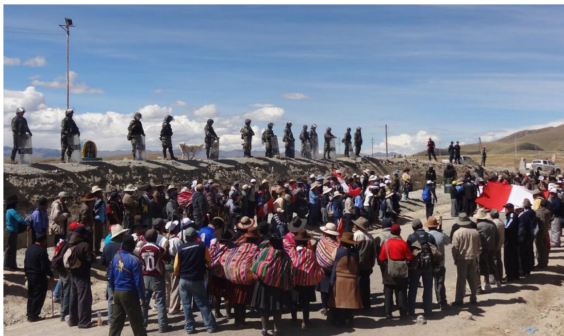
Foto 3.: Manifestación por los muertos y heridos en la intervención de las fuerzas del orden en Espinar, Cusco.

El conflicto entre Xstrata y la población llegó a un punto máximo en mayo del 2012, pues las denuncias de contaminación ambiental y afectaciones a personas y animales no estaban siendo esclarecidas y la empresa se negaba a iniciar discusiones sobre un nuevo Convenio Marco. El Gobierno peruano declaró la provincia en emergencia, a raíz de ello se produjeron varias detenciones (23 en el interior del campamento minero), tres personas murieron, decenas quedaron heridas. Las declaraciones presentadas por los detenidos, dieron cuenta de torturas recibidas por los efectivos policiales en el momento de la detención.