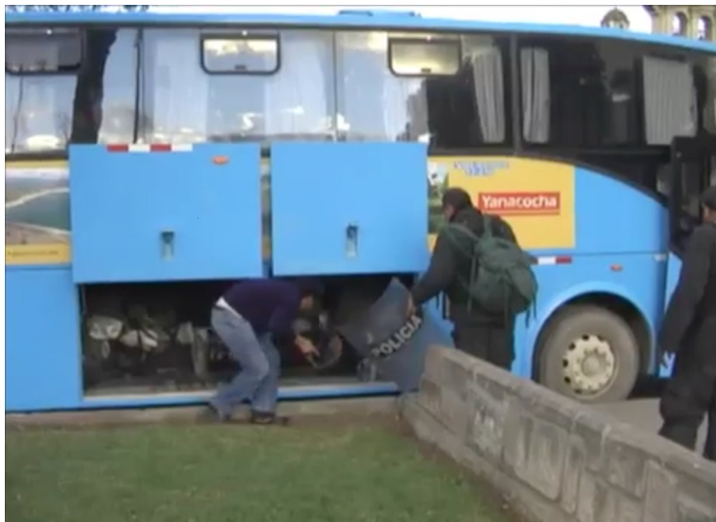
Foto 2.: Autobús de Yanacocha transporta un grupo de policiales durante el conflicto por el proyecto minero Conga en Cajamarca.