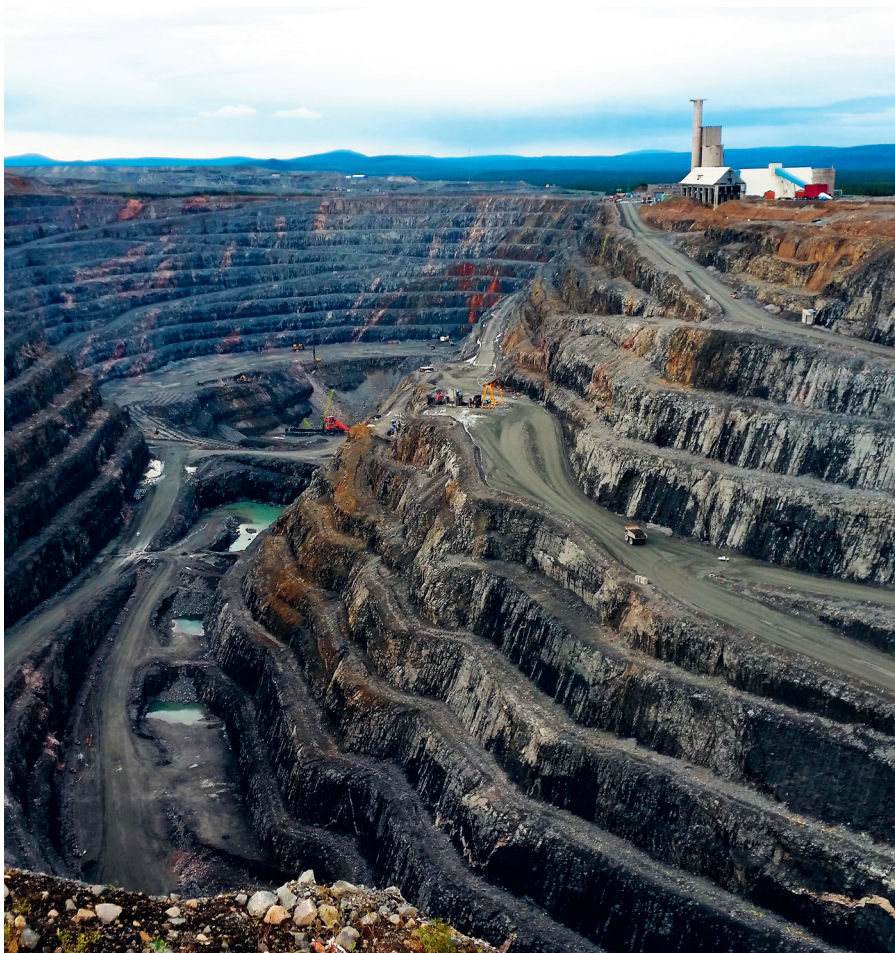
Une mine de cuivre au nord de la Suède.